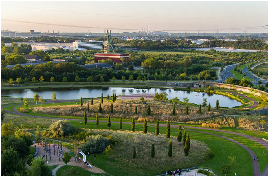
Essen, Krupp-area in the past and today