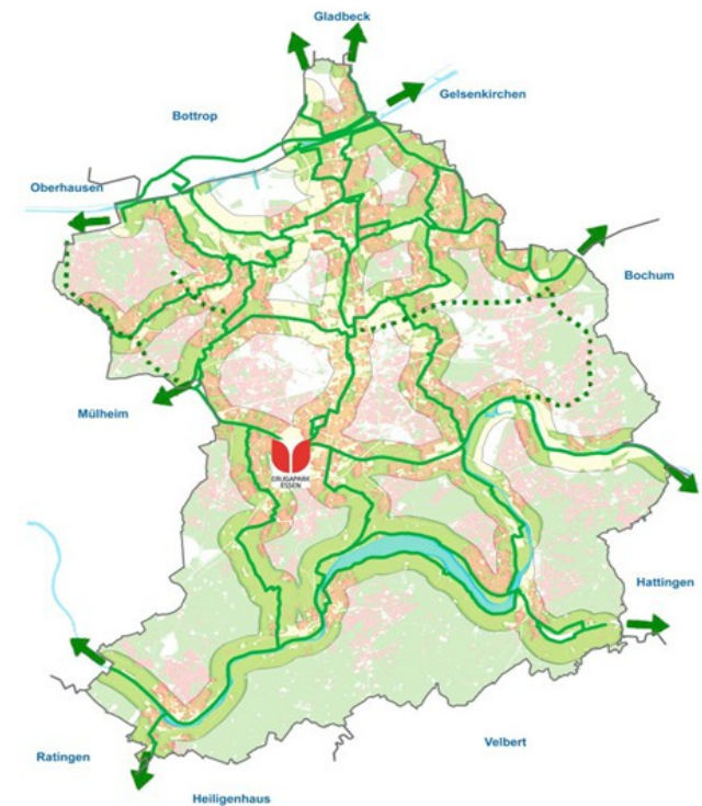
Green main routes

Accessibility of the green path network within 500 m distance for each inhabitant of the city